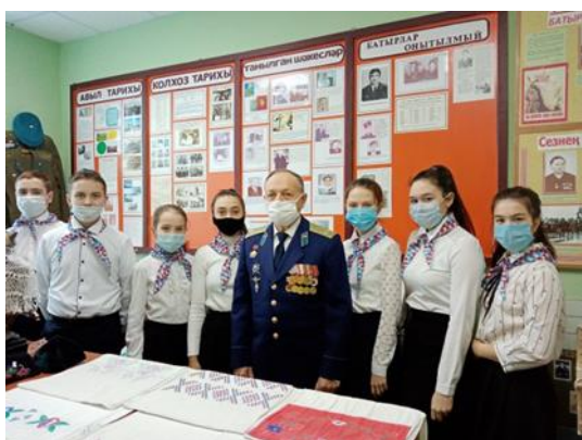
Рис.6 Классные встречи