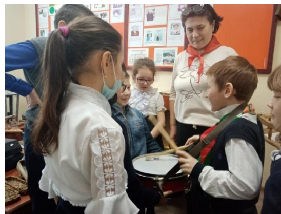
Рис.10 Изучении истории пионерского движения