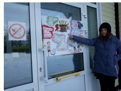
Рис.5 Курить вредно!

Интернет рейтинг работ участников флэшмоба.