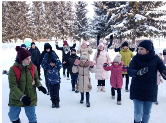
Рис.15 День здоровья