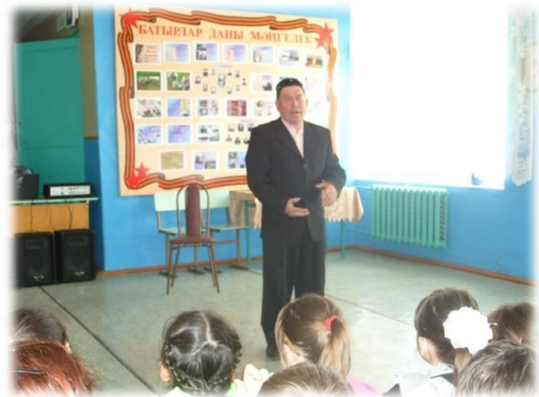
Рис.14 «Ветеран тыла живет рядом»