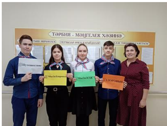
Рис.1 Мы за здоровье!