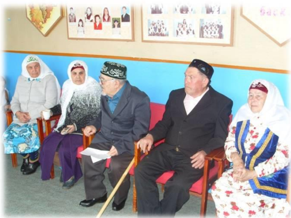
Рис.13 «Ветеран тыла живет рядом»