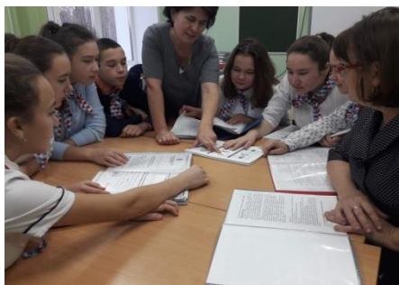
Рис.4 Выполнения плана проекта