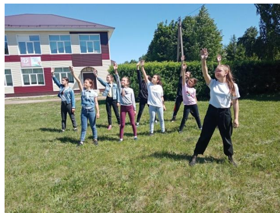
Рис.2 Флэшмоб «ЗОЖ»

Цель: Привлечь внимание к здоровому образу жизни, занятию спортом, профилактика курения, алкоголизма и наркомании.