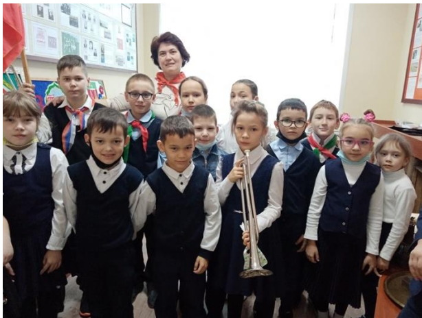
Рис. 11 Через прошлое к будущему