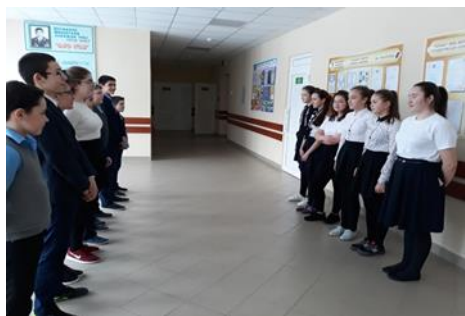
Рис.3. Выступление агитбригады

Участники в индивидуальном порядке и группами фотографируются с плакатами о вреде курения, создают небольшие фигуры о здоровом образе жизни. Свои фотоработы они выкладывают в группе флэшмоба. Организаторы мероприятия по завершении акции формируют и выкладывают в сети