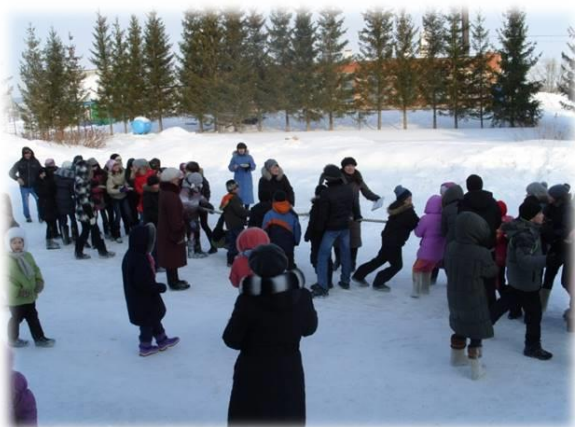
Рис.14 Патриотическая игра «Зарница»