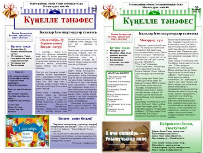
Рис.12. Веселая переменка